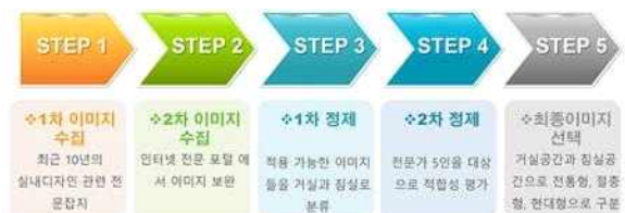
<그림 1> 단계별 이미지 수집 및 정제과정

수집된 이미지 자료들은 다음과 같은 정제과정을 거쳤다. 1차적으로 실내디자인특성 중 인테리어 디자인, 가구 디자인, 색채 및 마감재, 전망과 조경, 조명 4) 기반으로 한옥형 호텔 객실공간에 적용 가능한 이미지들을 거실과 침실로 분류하였다. 이와 같이 정제된 이미지들은 전문가 5인 5) (실내디자인 관련교수, 실내디자인)을 대상으로 적합성 여부를 평가하여 3인 이상 적합 판정을 받은 이미지를 선택 사용하였다(그림 1 참조).