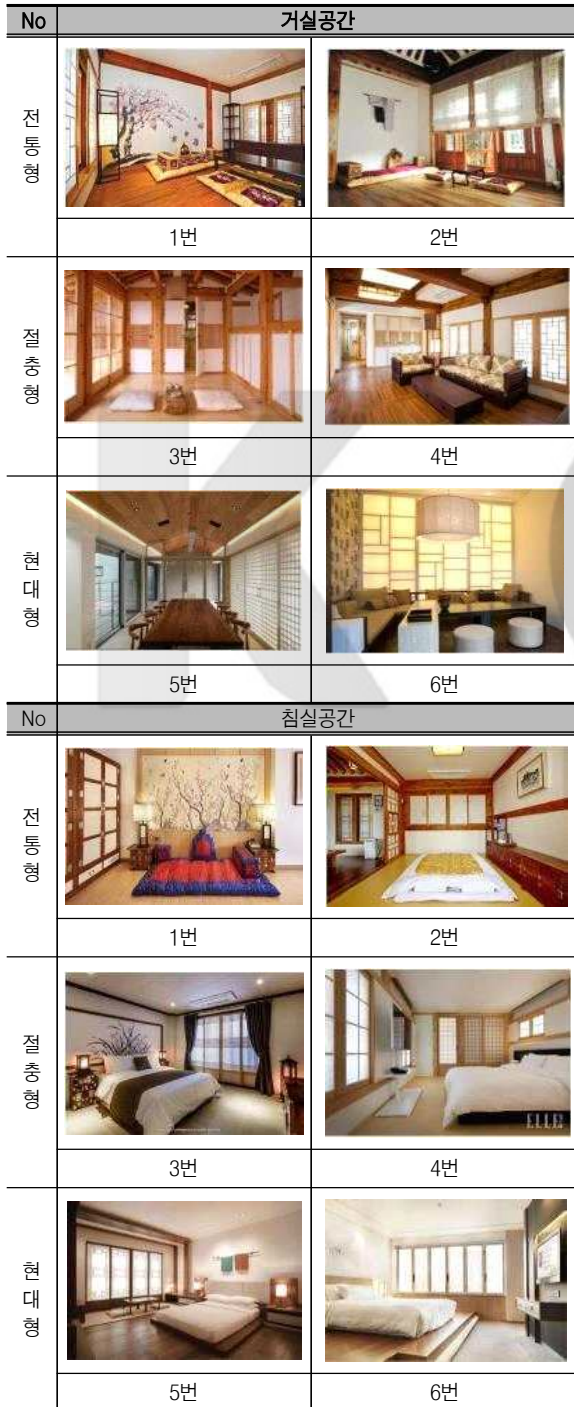
〈표 1〉 객실공간 선호이미지

성 적용 정도에 따라서 공간마다 전통형 2개, 절충형 2개, 현대형 2개로 구분하였다. 전통형, 절충형, 현대형에 선택된 각 2개의 이미지는 번호로 표기하였는데 각 항목 중 홀수번호에 해당되는 이미지는 그 중에서도 전통적 스타일이 강조된 것이고 짝수번호는 현대적 스타일이 강조된 것으로 조사자들에게는 이미지와 번호만 표기하여 제시하였다(표 1 참조).