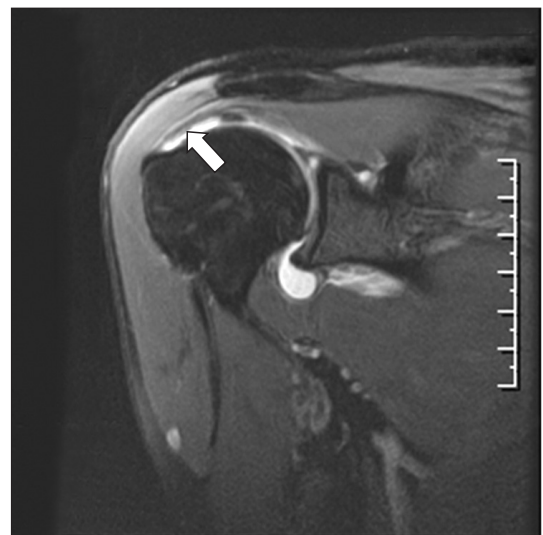
Figure 1. Oblique coronal T2-weighted image of magnetic resonance arthrography showing a partial thickness tear of the right supraspinatus in the articular side (arrow).

진단은 특히 던지기 종목에 참여하는 운동선수인 경우 최근 공의 속도, 제어능력(control), 지구력의 변화 및 후기 거상기/초기 가속기 때 경미한 불편감, 불안정감에서부터 찌르는 듯하게 심한 만성 통증까지 다양한 형태의 동통과 함께 참여 정도 및 위치 등에 대한 정보를 바탕으로 평가하고, 견관절에 대해 치료나 수술 받은 과거력이 있는지 확인하여야 한다. 신체검사는 견관절의 능동적 및 수동적 관절 운동 범위와 함께 동통 궁(painful arc), 근력, 신경 혈관 상태, 안정성, 특징적인 움츠림(shrugging) 등을 평가하고, O'Brien test, 48) Neer sign 49) 및 test, 50) Hawkins' test, 51,52) fulcrum & relocation test, 53) Jobe's test (캔 비우기 검사[empty can test] 54) 와 캔 채우기 검사[full can test] 55) , lag sign, 56) horn blower's sign, 57) lift-off test, 58) belly-press test, 59) belly-off sign, 60) Napoleon sign 61) 등을 시행하여 회전근 개, 관절와 손, 상완 이두근 장두 등의 상태를 검사한다. 충돌 시리즈를 포함한 방사선 검사, 자기공명영상(magnetic resonance imaging [MRI]) 혹은 자기공명관절조영술(magnetic resonance arthrography [MRA]) (Fig. 1) 등을 시행하여 확진하며, 이 외 초음파 검사, 관절조영술, 컴퓨터 단층촬영(computed tomography), 컴퓨터 단층관절조영술(computed tomography arthrography) 등을 시행하기도 한다. 그러나 회전근 개 부분층 파열은 임상적으로나 MRI 혹은 MRA를 이용하더라도 진단이 어려울 수 있다.